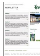
TPA E-Mail Newsletter