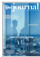
TPA Journal-Abo 2 mal jährlich wichtige Hintergrundinfos