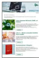
TPA E-Mail Newsletter