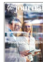
TPA Journal-Abo 2 mal jährlich wichtige Hintergrundinfos